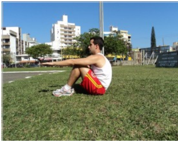
Foto 15: Posição Inicial e Final ( Posição “Um”) - Visão Lateral Foto 16: Posição “Dois” - Visão Lateral